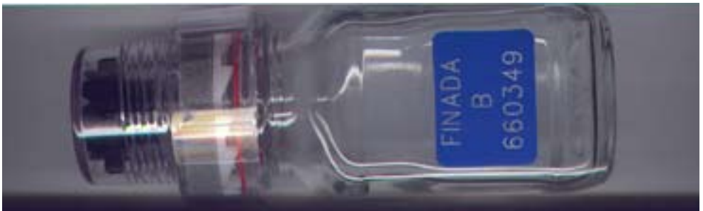
Doping-näytepullo, joka suljetaan siten, että avaaminen tapahtuu korkki rikkomalla.

8. Jos näyte ei täytä laboratorion asettamia vaatimuksia pH:n ja/tai ominaispainon suhteen tai jos näytteenannossa ilmenee jotain epäilyttävää tulee sinun antaa uusi näyte.