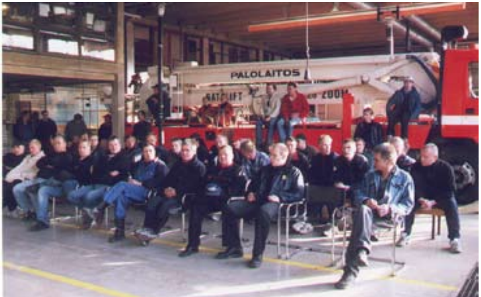
Palolennot harjoitukseen osallistuneita Tammisaaren palolaitoksen kalustohallissa.

Keväällä oli palokuntien kanssa yhteisharjoitukset Nousiaisissa ja Tammisaaressa. Harjoituksiin osallistui TLK:n väkeä Nousiaisissa 2 koneella 8 henkilöä ja Tammisaaressa 1 koneella 4 henkilöä. Palokunnille pidetyssä teoriaosan koulutuksessa Nousiai-